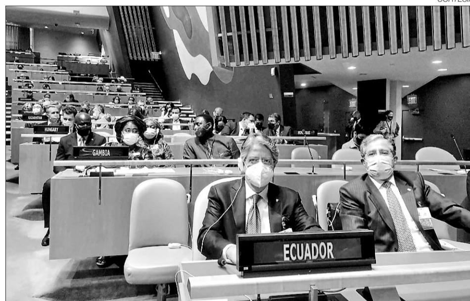
• El Presidente de la República, Guillermo Lasso, en la Asamblea General de la ONU.

Este tipo de servicio fue aplicado durante el periodo de cambios de domicilio en el año 2020, previo a los comicios presidenciales del 2021.