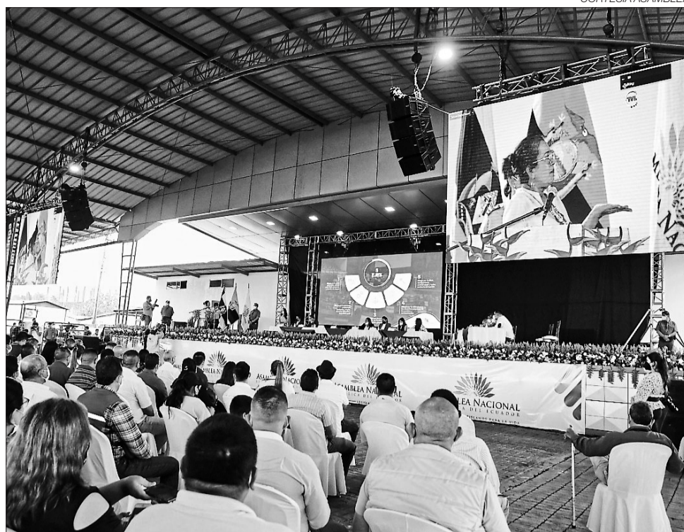
• La presidenta Guadalupe Llori, en un evento en Orellana el 29 de julio pasado.

El experto explicó que el cálculo se da en función del salario de los servidores públicos, y que varían de acuerdo con la autoridad jerárquica que ocupa un puesto público. “Lo que necesita es presen-